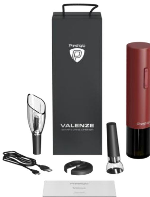
Obrázek 2 - Vzhled

Díky svému minimalistickému designu doplní vývrtka Valenze interiér malé domácí kuchyně i velkého banketního sálu. Tělo vývrtky je vyrobeno z kovu, takže je ideálním dárkem pro milovníky vína.