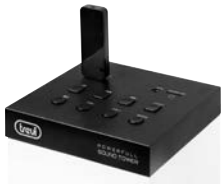
INGRESSI USB USB CHARGE MICRO SD / AUX-IN