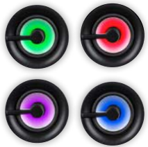
DISCOLIGHT LED / INDICAZIONE DELLE FUNZIONI