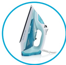
Stabilní stojan pro odkládání žehličky