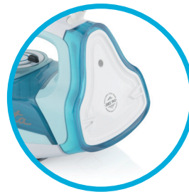
Možnost navinutí přívodního kabelu