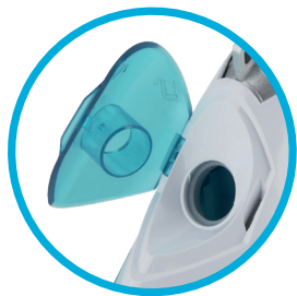
Snadné a velmi rychlé plnění a vylévání